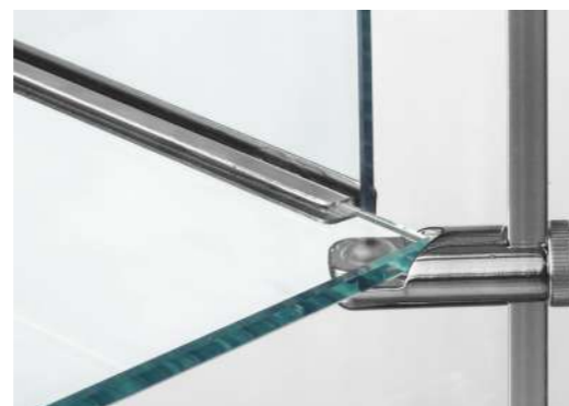
Sistema fissaggio mensole di nuova concezione Neu entwickeltes Befestigungssystem für Bügel

Jedes Element von Pivot ist so konzipiert, dass es Ihnen ein hohes Maß an Komfort und ein Höchstmaß an Liebe zum Detail bietet.