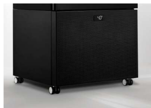
4 ruote pivotanti con sistema di bloccaggio 4 schwenkbare Räder mit Verriegelung