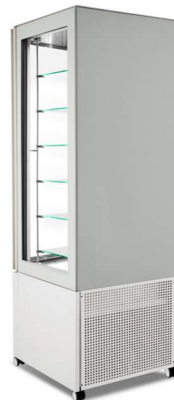
Pivot 3 lati Pivot 3 Seiten