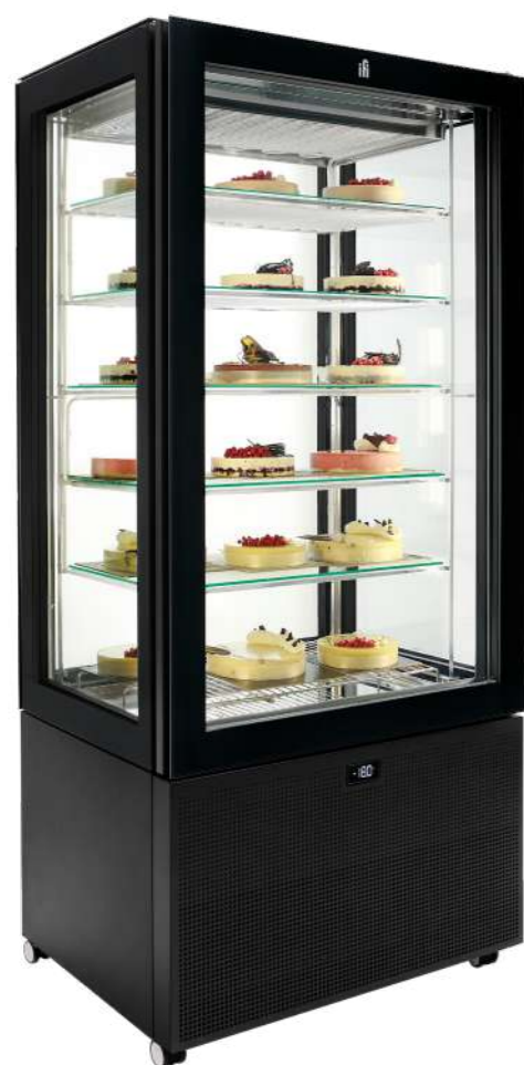
Pivot statico H 1900 mm Statischen Pivot H 1900 mm