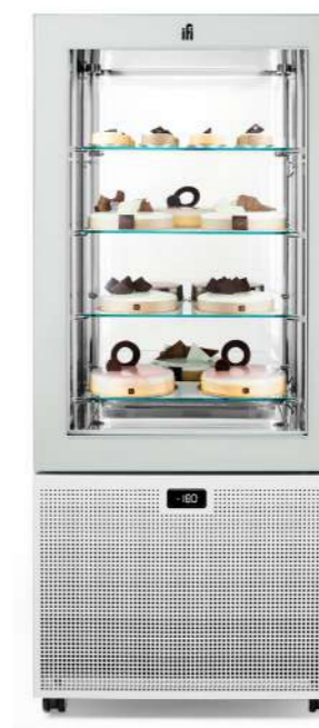
Pivot H 1550 mm