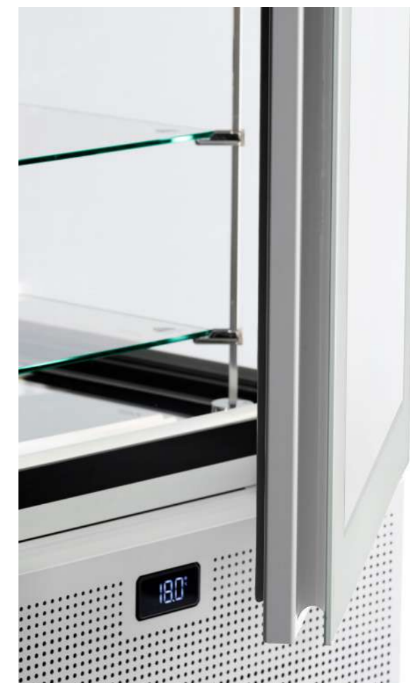
Maniglia integrata e display elettronico full touch Integrierter Griff und elektronisches Full-Touch-Display

Mit Pivot können Sie sich von der Kondenswasserbildung verabschieden: Die beheizte Doppelverglasung auf jeder Seite, die immer funktioniert, auch wenn sie nebeneinander oder in der Vitrine positioniert ist, bietet maximale Sicht; das Antibeschlagsystem an der Tür verhindert das Beschlagen nach dem Öffnen. Die ausgestellten Kreationen kommen dank der neu gestalteten Einlegeböden besonders gut zur Geltung und werden dank der 3 in die Struktur integrierten LED-Leisten durch diffuses und streifendes Licht aufgewertet. In der belüfteten Version (H 1900 mm) nutzen die 6 Ausstellungsflächen dank des im Sockel eingebauten Verdampfers den Raum optimal aus, für eine noch großzügigere und barrierefreie Präsentation, für eine formale Sauberkeit, die Pivot zu einem einzigartigen von einzigartigem Design macht.