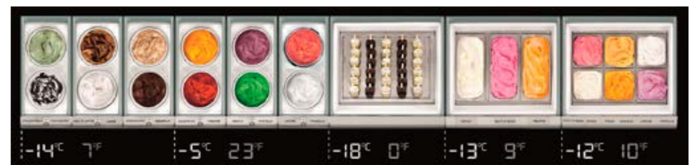
Gestione della temperatura Temperaturverwaltung