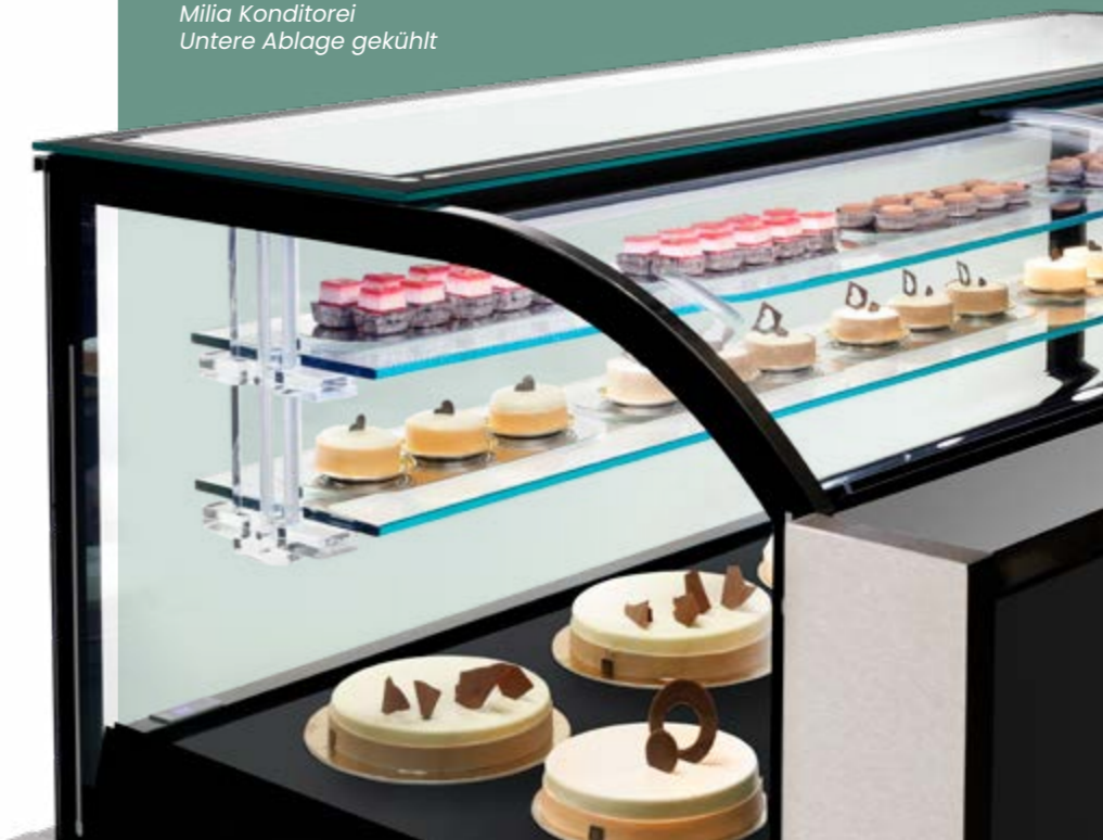
Milia Pasticceria Mensola inferiore refrigerata Milia Konditorei Untere Ablage gekühlt