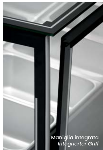
Maniglia integrata Integrierter Griff

Leistungsstarkes, belüftetes Kühlsystem mit doppelter Verdampferanlage, differenzierter Abtauung und HCS-System. Mit Milia behalten Ihre Produkte alle ihre ursprünglichen Eigenschaften, selbst unter den kritischsten Umgebungsbedingungen wie Hitze und Feuchtigkeit.