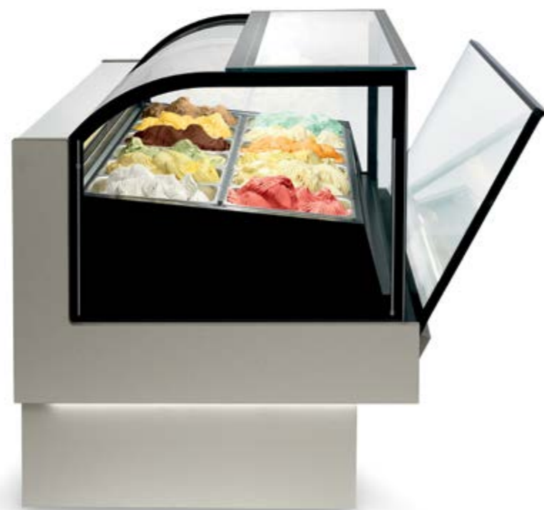
Apertura servoassistita dall'alto verso il basso Öffnung mit Servoantrieb von oben nach unten

In der Konditorei wird die großzügige Ausstellungsfläche mit weißer oder schwarzer matter Oberfläche zum perfekten Hintergrund für Ihre Kreationen.