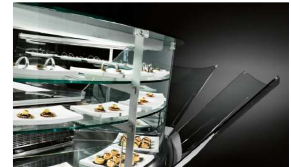
Vetri alti dritti (VAD) Hohe gerade Scheiben (VAD)