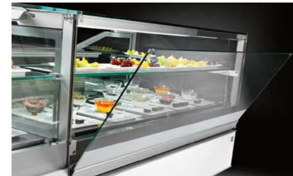
Vetri bassi dritti (VBD) Niedrige gerade Scheiben (VBD)

In der belüfteten Version Mix bietet die perfekt auf den Beckenrand ausgerichtete Oberseite eine bündige Auslage, die jede Sichtbarriere beseitigt, und die Antikondensationseigenschaften der Vitrine, das vordere Schutzglas und die beheizten Seiten garantieren jederzeit eine perfekte Sicht auf Ihre Spezialitäten.