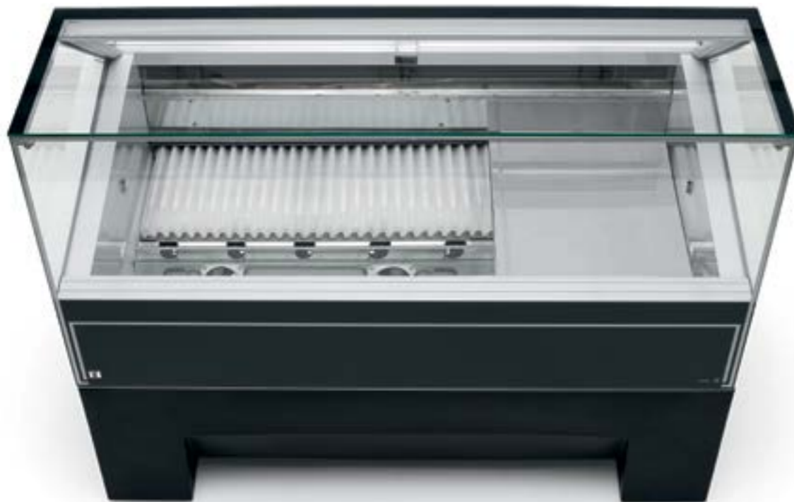
Hybrid Cooling Technology: accumulatore di freddo Hybrid Cooling Technology: Kältespeicher

Guide degli scorrevoli integrate nel piano lavoro In der Arbeitsplatte integrierte Führungen der Schiebetüren