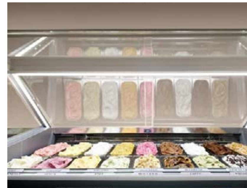
Illuminazione perimetrale a LED 4000K LED-Umfangsbeleuchtung mit 4000 K

Das große Pyrolyse-Frontglas, beheizt und gehärtet, sorgt für extreme Transparenz ohne Kondensation, die Ihre Eiscreme hervorhebt. Der LED-Lichtrahmen, umlaufend und integriert, hebt Ihre Kreationen noch mehr hervor und macht sie zu absoluten Protagonisten.