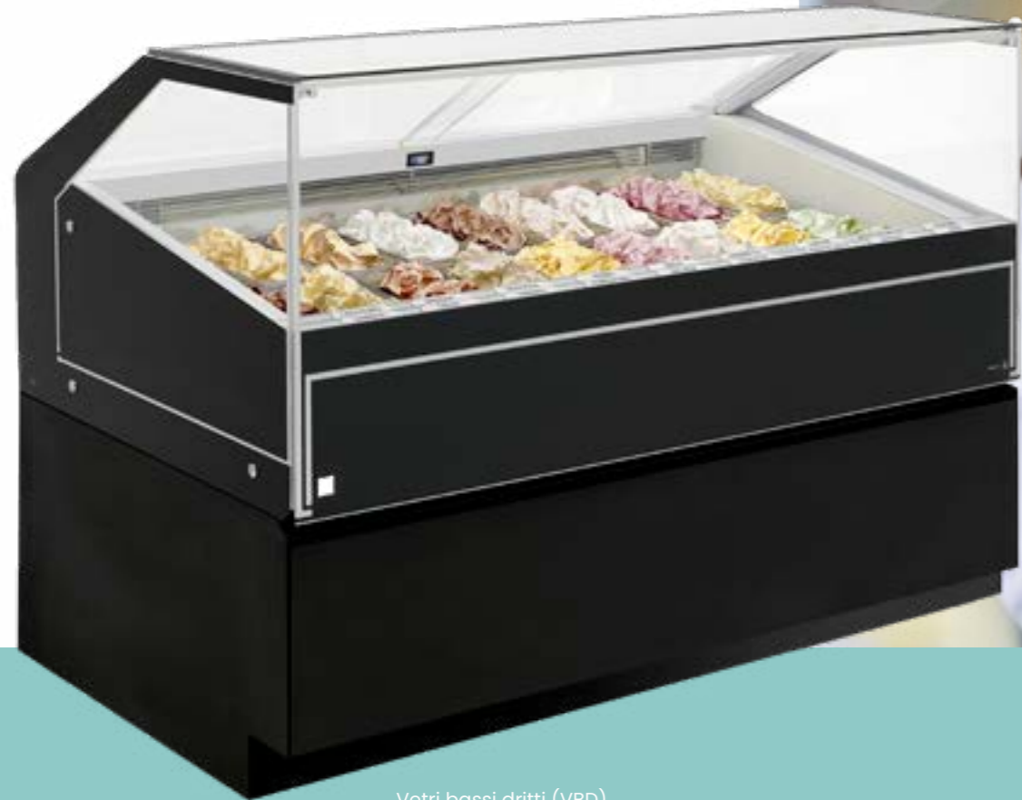
Vetri bassi dritti (VBD) Scheiben niedrig gerade (VBD)